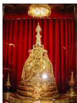
วัดพระเขี้ยวแก้ว