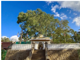
พระศรีมหาโพธิ์