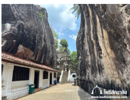
อาโลกวิหาร

เมืองสิริกริยา นำท่านเดินทางขึ้นสู่ ยอดเขาสิกริยา (SIGIRIYA) เป็นยอดเขาที่สูงที่สุด เดินขึ้นบันได 2,200 ขั้น บนยอดศิลาจะพบซากปรักหักพังของพระราชวังในอดีต ชมพระราชวังลอยฟ้า พระราชวังสิกริยา (Sigiriya Palace) พระราชวังบนยอดเขา อ่างเก็บน้ำโบราณและวิวทิวทัศน์ของเมืองสิกริยา ชม บัอมปราการ หรือ ประตูลิงโต เป็นสิ่งมหัศจรรย์แห่งเดียวบนเกาะนี้ รู้จักกันดีในชื่อ LION ROCK หรือ แท่นศิลาราชสีห์ ชม ภาพเขียนสีเฟรสโก เป็นภาพนางอัปสรสวรรค์ ที่มีอายุพันกว่าปีและถูกจัดให้เป็นสิ่งมหัศจรรย์ของโลก