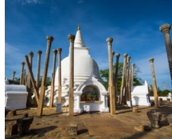
พระเจดีย์อูปราม