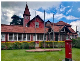
ไปรษณีย์