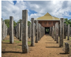
โลหะปราสาท