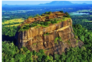
พระราชวังศรีศิรียา

วันศุกร์ ที่ 17 เดือนพฤษภาคม พ.ศ. 2567 คัมมูลลา (Dambulla cave) เมืองศรีศิรียา (Sigiriya City) (วันที่สาม)