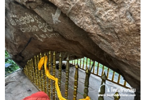
วัดมหินดเล