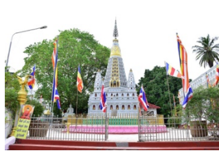
ที่ปะทุฎฐาราม