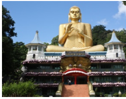
พระพุทธรูปใหญ่สีทอง