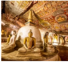
วัดถ้ำคัมมูลลา