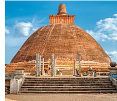
เจตวนามมหาสถูป