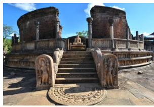
วาทะทะเก