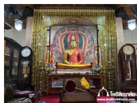
วัดบุปผาราม

วันเสาร์ ที่ 18 เดือนพฤษภาคม พ.ศ. 2567 เมืองมะตะเล (Matale), เมืองแคนดี้ (Kandy City) (วันที่สี่)