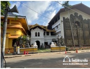
วัดกัลณียารามมหาวิหาร