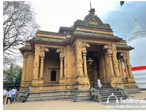
วัดคังการาม