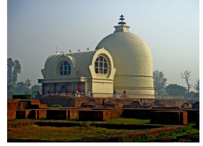
ปรินิพพาน (กุสินารา)

พระพุทธพจน์ “ดูก่อนอานนท์ สังเวชนียสถาน ๔ แห่งเหล่านี้เป็นที่ควรเห็นของผู้มีจิตศรัทธา สังเวชนียสถาน ๔ แห่งนี้ คือ สถานที่ประสูติ ตรัสรู้ แสดง ธรรมจักร ปรินิพพาน เทียวจาริกไปยังเจดีย์ มีจิตเลื่อมใสแล้ว เมื่อถึงแก่กรรมลงชนเหล่านี้ทั้งหมด จักเข้าถึงสุคติโลกสวรรค์” (ทีฆนิกาย มหาวรรค)