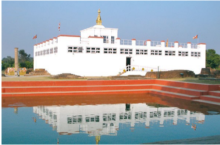
ประสูติ (ลุมพินี)

สังเวชนียสถาน ท่านละ 22,000 บาท (9คืน 11วัน) บินตรงยกยา 29,000 พักวัด+โรงแรม