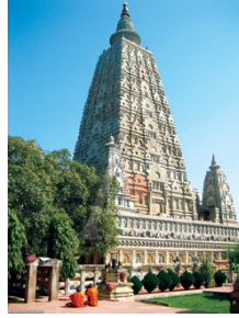
ตรัสรู้ (พุททคยา)